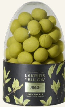
LIME CRACKLE ÆGG