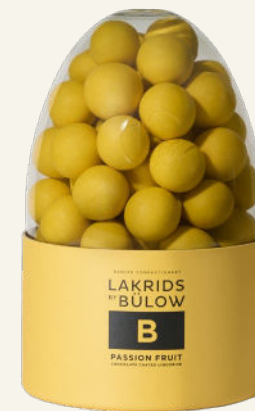
B - PASSION FRUIT ÆGG