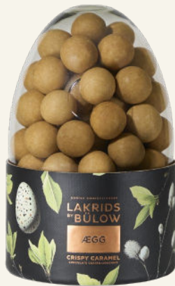
CRISPY CARAMEL ÆGG

Sweet liquorice coated in white chocolate and passion fruit - what more could you want? I år er vi glade for at kunne reintrodere den farvestrålende gule ÆGG-version af vores populære smag, B - PASSION FRUIT, hvilket gør den til en fantastisk tilføjelse til årets SPRING-kollektion.